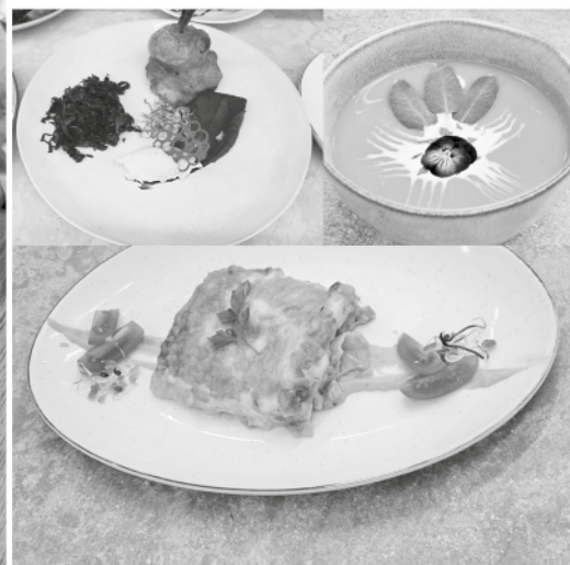
Márton napi háziverseny