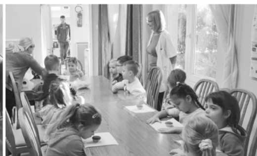
Sásdi ovisok a SVIKI-ben