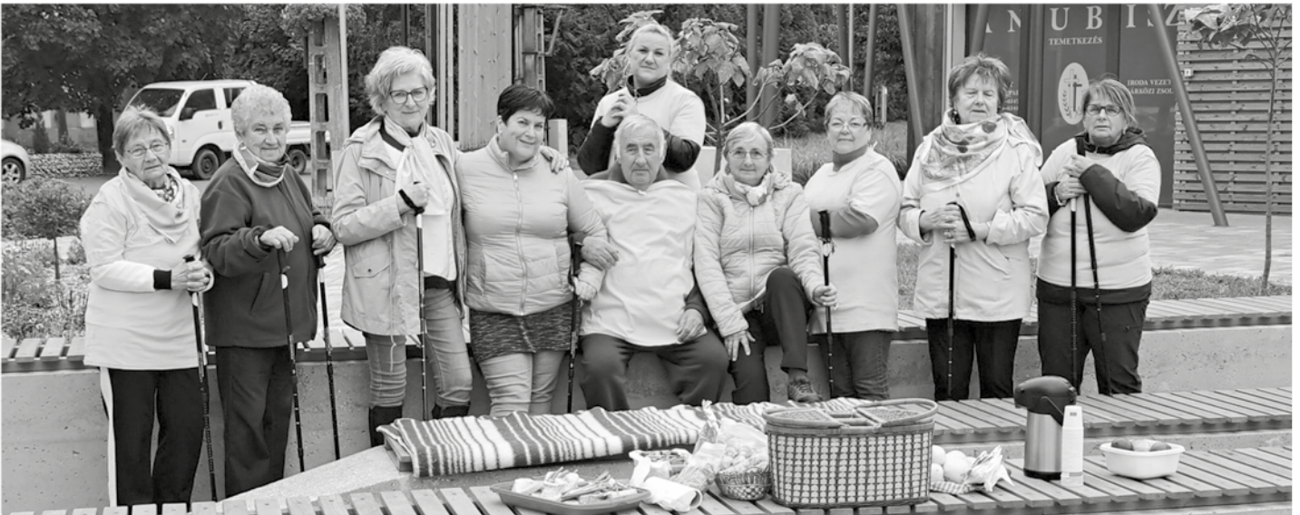
SILGYA Klub - piknik

● 07-én a dombóvári idősek klubjával találkoztunk Gunarasban, ahol megvendégelték bennünket egy finom ebéddel és szenior örömtánccal telt az idő. Köszönjük a szíves vendéglátást!