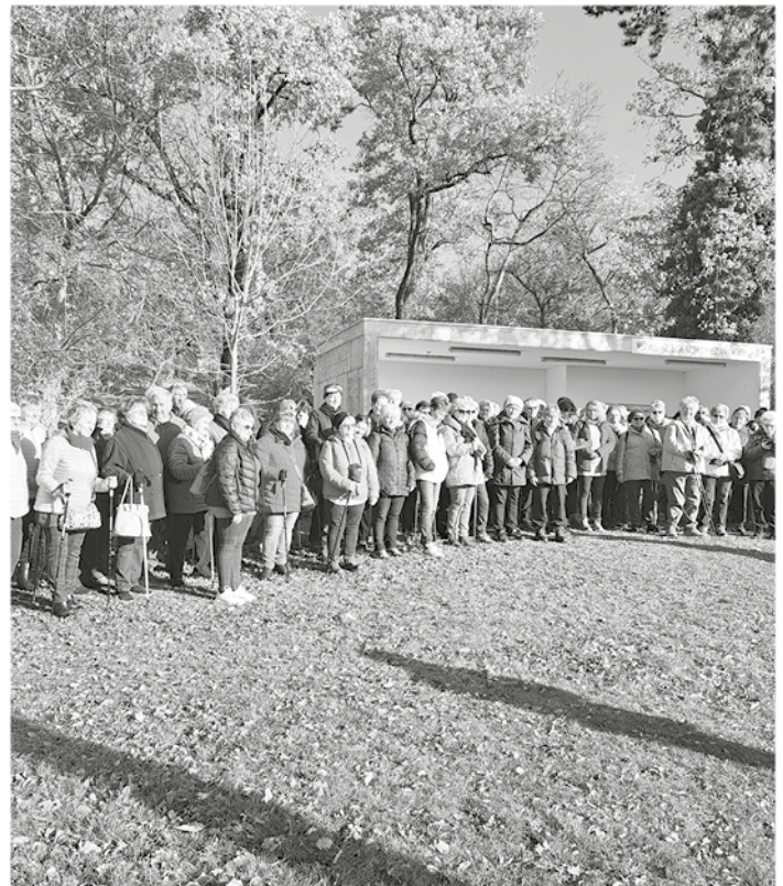
SILGYA Klub a Mecsekben a pécsi Keddi Túracsoporttal

● 22-én Harkányban bowlingoztunk, melyre az „Életet az Éveknek” Nyugdíjas Szövetség szervezése kapcsán volt lehetőségünk.