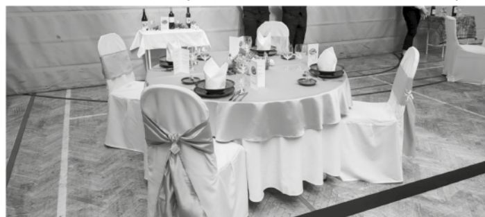
Garai verseny terítés