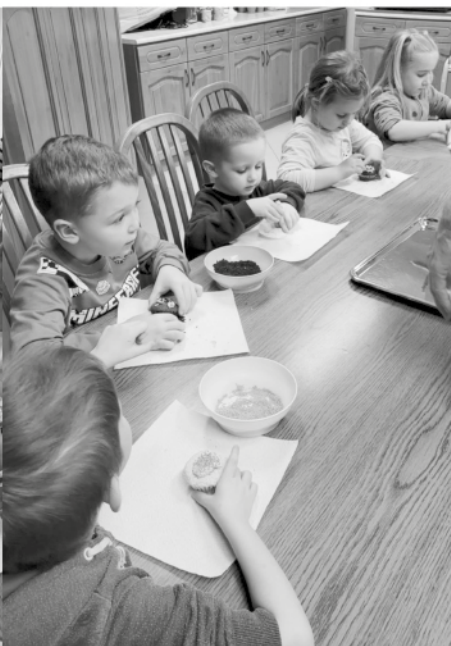
Sásdi ovisok a SVIKI-ben