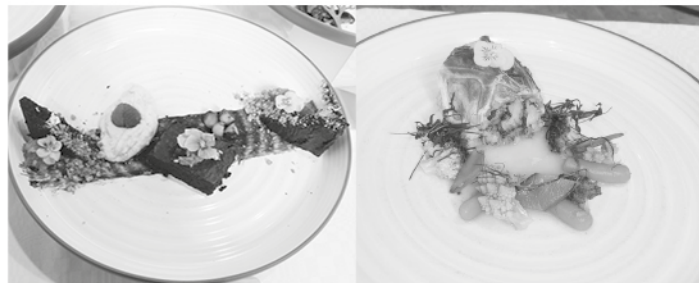
Garai verseny desszert