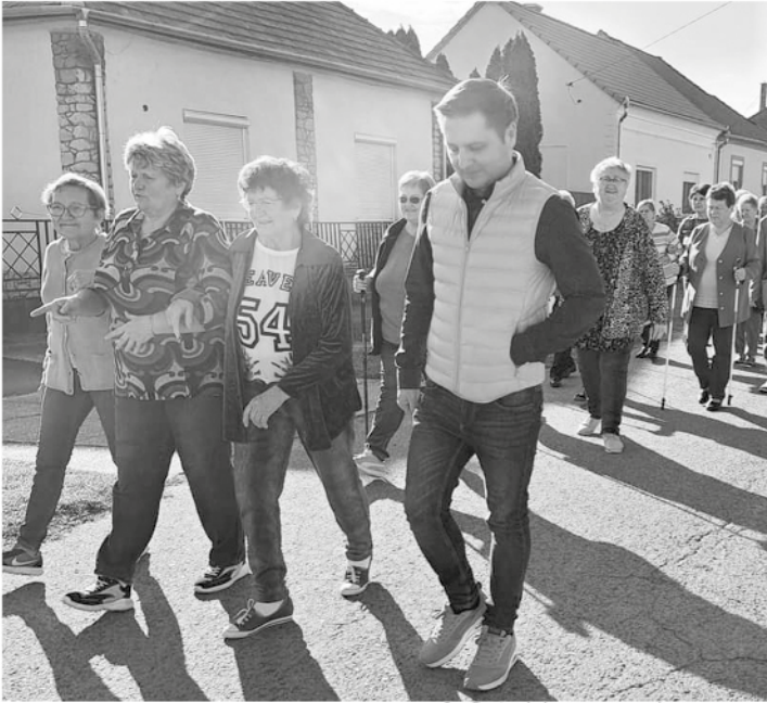
SILGYA Klub - túra a polgármesterrel