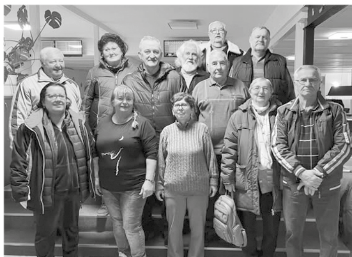
Harkány - bowling

• 05-én Magyarországon jártunk, az Idősek Világnapja alkalmából kaptunk meghívást a helyi idősek klubjától – Parkettareccsentő szenior örömtánc csoport fellépésével.